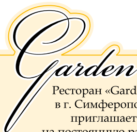
График работы сменный, зарплата официальная, полный социальный пакет

Ресторан «Garden» в г. Симферополь приглашает на постоянную работу